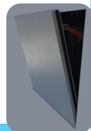
Detalle - corte