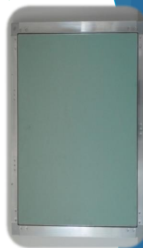
Vista exterior (como fornecido)